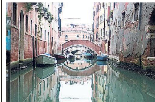
Il Centro Studi Tedesco

Il Centro Tedesco di Studi Veneziani è ormai una realtà quarantennale, un motore di cultura e sperimentazione creativa che organizza ogni anno incontri e convegni legati a Venezia, alla sua storia, al suo territorio. Un vero e proprio ponte tra conoscenza tedesca e italiana, tra Europa centrale e una città che è sempre stata soggetto di multiforme identità, per secoli e secoli crocevia tanto di merci quanto di idee tra Occidente e Oriente. Un termine, "ponte", particolarmente calzante per quanto riguarda il programma culturale della prima metà dell'anno 2018, presentato ieri nella sede del Centro di Palazzo Barbarigo della Terrazza.