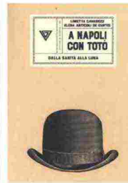
Loretta Cavaricci, Elena Antiucoli De Curtis, A Napoli con Totò , Giulio Perrone editore, 144 pagine, 12 €

Tante guide raccontano la Napoli di Totò. Questo libro, invece, che ha per coautrice la terza nipote del principe De Curtis, fa un'operazione più sofisticata e ironica: propone passeggiate in città, visite in chiese e teatri, perlustrazioni di rioni e strade legate al personaggio intervallandole con brani di Totò, tratti da interviste, raccolte, libri. Così la Napoli contemporanea appare ancora come il palcoscenico da cui l'illustre cittadino non si è mai allontanato.