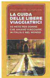
Manuela Bolchini, Iaia Pedemonte, La guida delle libere viaggiatrici , Altreconomia Edizioni, 208 pagine, 14,50 €

"Viaggiamo perché il viaggio ci riconnette con noi stesse, per un'avventura culturale, per cercare la ragazza che c'è in noi", dice Phyllis Stoler, presidente di Women's Travel Club, associazione canadese per sole viaggiatrici. Questo agile volumetto suggerisce 50 esperienze, in Italia e nel mondo, esclusivamente per donne, disposte persino a viaggiare da sole, secondo una tendenza in crescita. Molte avventure aprirebbro il cuore e la mente anche agli uomini, comunque.